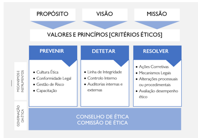
Figura I – Modelo de Integridade do Grupo AdP

O eixo “ Resolver ” integra as medidas a implementar, as metodologias de remediação para garantir a plenitude do modelo e a avaliação do desempenho ético do Grupo AdP através dos indicadores de desempenho ético.